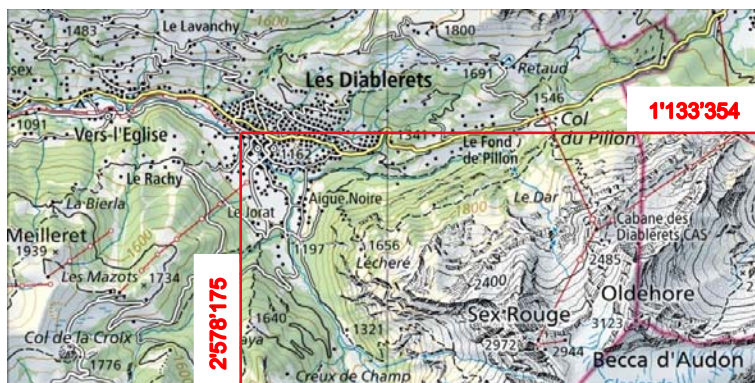
Figure 1 : Situation générale