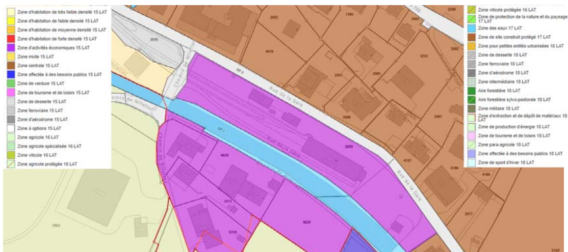
Figure 2 : Affectation des sols - Source : geo.vd.ch